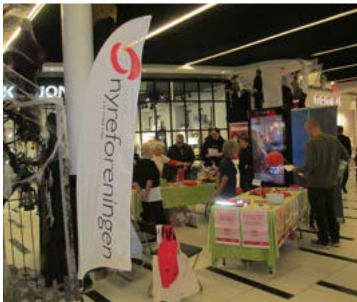
Organdonationsdagen på Borgen i Sønderborg