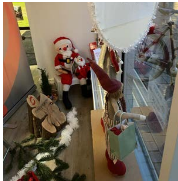
Til jul pynter vi igen vindue i Frivillighedens Hus