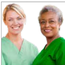
Dialyse i udlandet s. 8