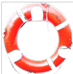
Forsikring s. 5