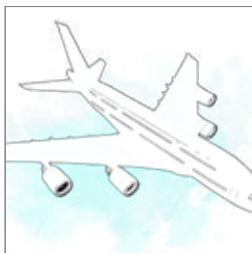
Behandling på ferien s. 7