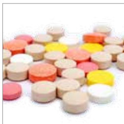
Medicin s. 6