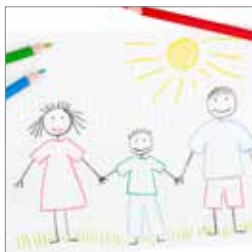
Familiens liv s. 9