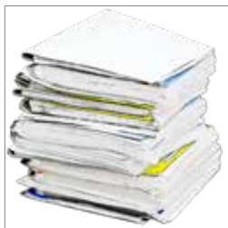
Ret til undervisning s. 11