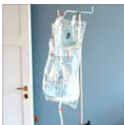
P-dialyse s. 10