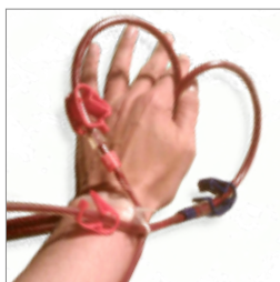
Hæmodialyse s. 14