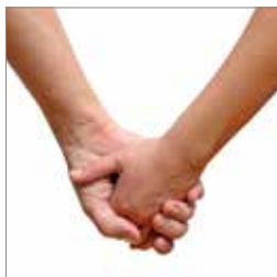
Parforholdet s. 7