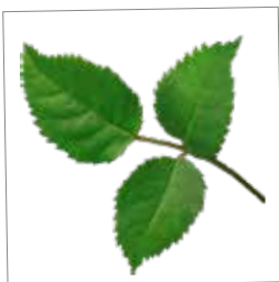
Støt et godt formål s. 10