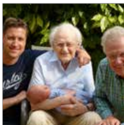
Hvorfor testamente? s. 5