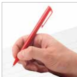
Hvordan oprettes det? s. 6