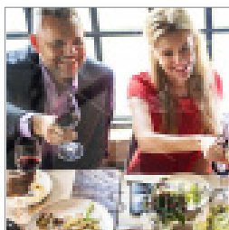
Dit nye liv s. 7