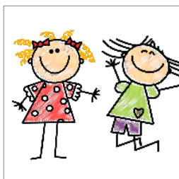
Hvad med børn? s. 10