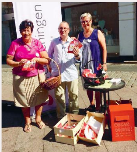
Her ses fx Sydøstjyllandskredsen til Nyrernes dag.

Lørdag den 27. maj fejrede Nyreforeningen landet over den årlige Nyrernes Dag, hvor vi hvert år sætter fokus på blandt andet nyresygdom og organ donation. Fra Skive til Sønderborg, over Odense, Taastrup og Rådhuspladsen var der solskin og højt humør, da Nyreforeningens frivillige stillede op med balloner, lys og donorkort til en oplysende folkefest.